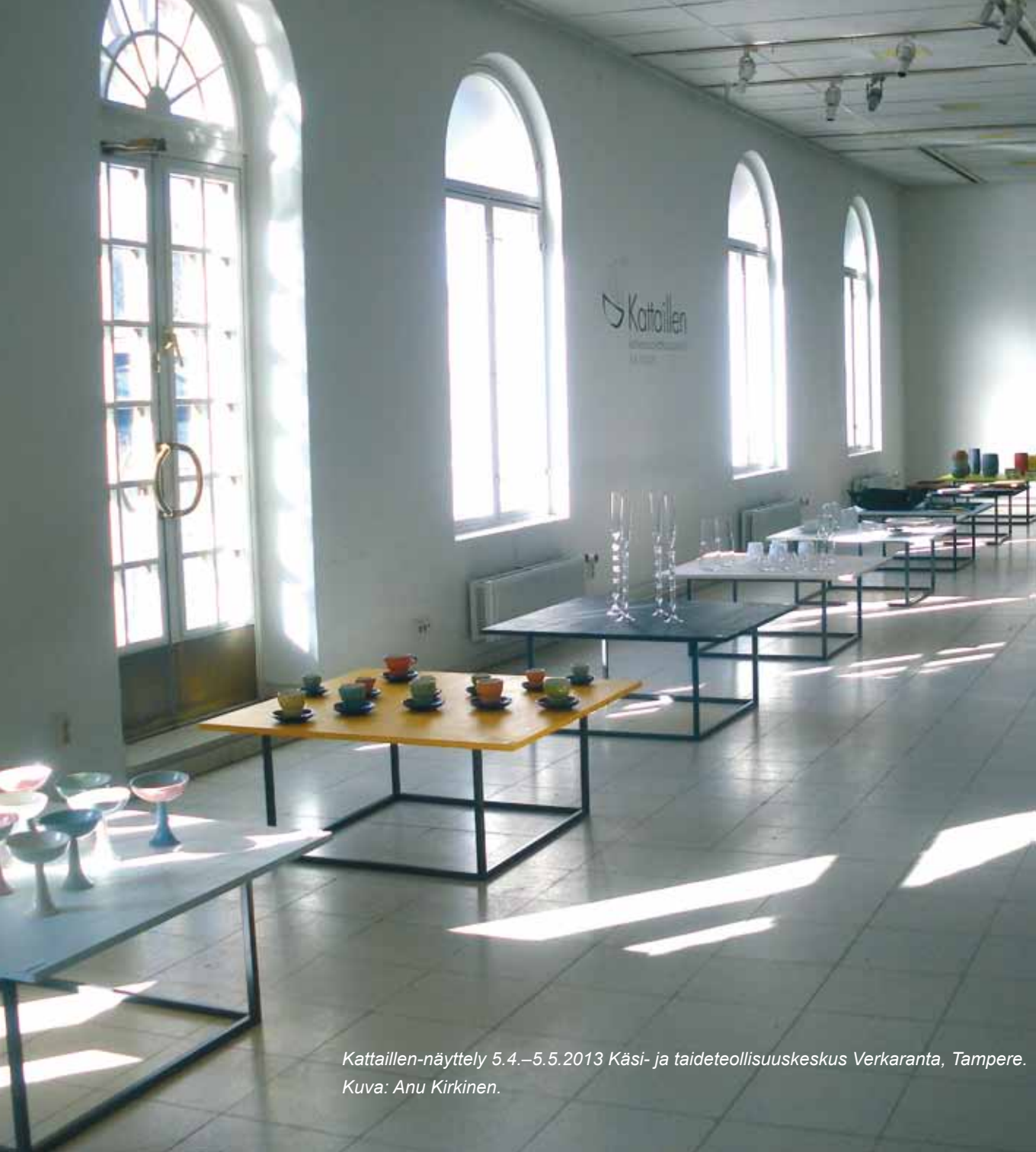
Kattoillen-näyttely 5.4.–5.5.2013 Käsi- ja taideteollisuuskeskus Verkaranta, Tampere.