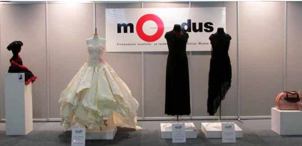
Muotoillen! -näyttely, Suomen Kädentaidot 2013.

Näyttelytilan lisäksi yhdistyksen jäsenet esittelivät ja myivät omia tuotteitaan kolme päivää kestävässä messutapahtumassa. Mainittakoon vielä, että Suomen Kädentaidot Uutuustuote 2013 -tunnustuksen sai Kehä sivupöytä, jonka on valmistanut Moduksen jäsen Arto Halmetoja Orivedeltä.