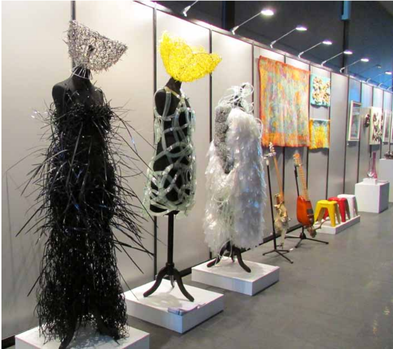
Taidekäytävä, Tampereen Taidemessut 2013.