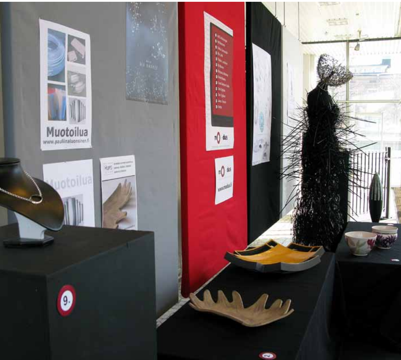
ManseDesign-näyttely, Tampereen Virastotalon näyteikkuna.